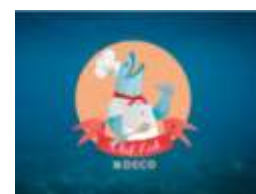
Imagem 2 – Participação em Concursos