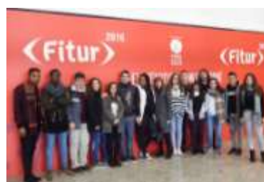
Imagem 1 – Visita A Madrid (FITUR)